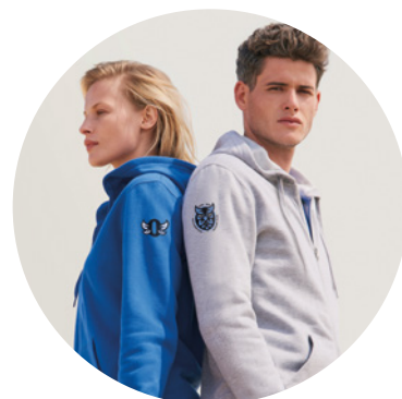
Tailles homme et femme