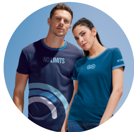
Inspiré par SOL'S