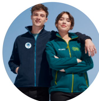
Inspiré par SOL'S

Délai de livraison à partir de 6 semaines.