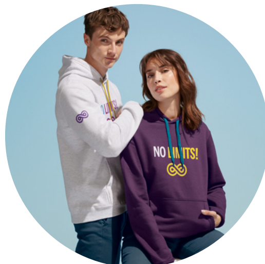
Inspiré par SOL'S