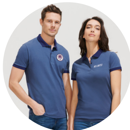
Inspiré par SOL'S