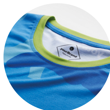
Impression jusqu'au bord