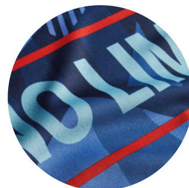
Impression en quadri

Incluez les shorts et créez un kit complet!