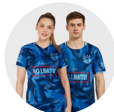
Tailles homme et femme