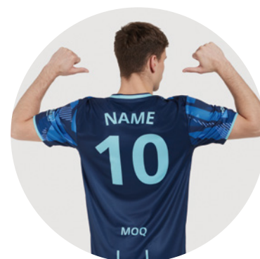
Noms et numéros individuels